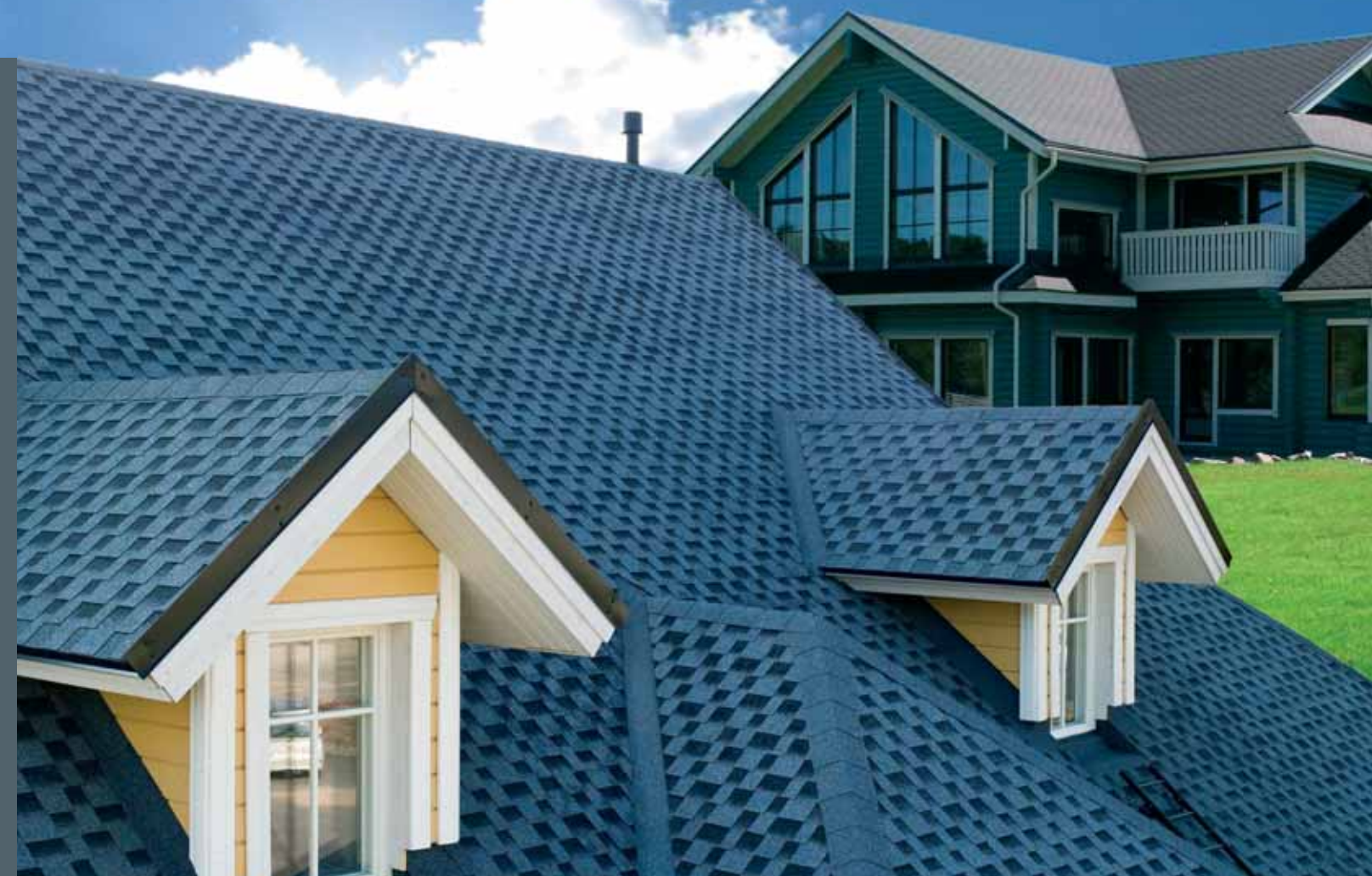
KERABIT S – vlina